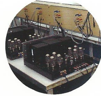
國企級實力 珠海斯巴克工廠之旅

isf THX 影音詳測選購教學專門誌 | 隔周五出版 | 2013.11.29