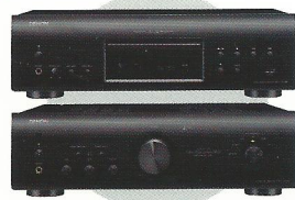
純種日本製音響 Denon DCD-1520AE PMA-1520AE